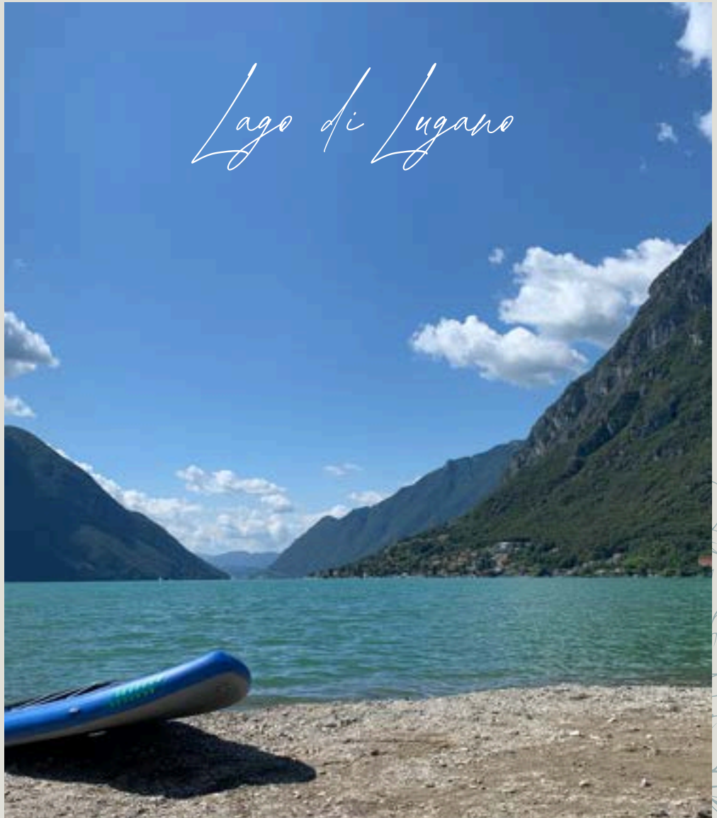
Lago di Lugano